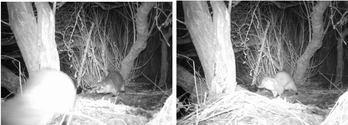
Waarnemingen van otters in het plassengebied

Het beeld is dat er op en om de Reeuwijkse Plassen wellicht twee mannetjes hun territorium kunnen hebben, met ieder een of twee vrouwtjes. Zover lijkt het echter nog niet te zijn. Goede rustplekken en nestplaatsen in bosjes die met rust worden gelaten, zijn er voor hen niet gauw genoeg.